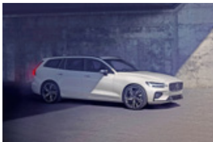
V60 T6 | V60 T8 ETU 4 600€

Kaikki Volvon 60-sarjan mallit – V60, S60 ja XC60 – sekä XC40** ovat nyt saatavana hyvin varusteltuina Edition -malleina. Saat taatusti vastinetta rahalle. Edition -mallien saatavuus on turvattu ja niiden varustelutasot ovat Volvon tapaan kattavat – ja etenkin ylelliset Inscription- ja urheilulliset R-Design -versiot tarjoavat huippuluokan varustelun. Valitse Suomen ostetuin* lataushybridi tai kevythybridi (benssiini tai diesel).