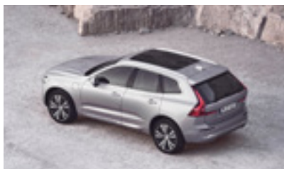
XC60 ETU 3 000€