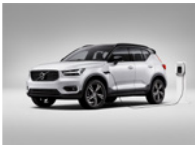
XC40 ETU 1 300€